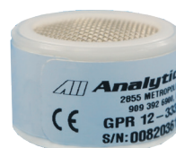
センサーイメージ画像

サンプル・ラインを切り替える際に混入する可能性のある高酸素濃度のガスからセンサーをアイソレート(隔離)することが可能になります。これにより酸素センサーの寿命が延び、配管がフラッシュされるまで低ppm O 2 のサンプルがセンサーセルに閉じ込められるため、プロセス測定に到達するまでの時間が短縮されます。